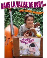
DANS LA VALISE DE BOBY... Spectacle interactif et ludique dans le monde de Bobby Lapointe

THEATRE MAGIQUE – Marinette au Pays de la Magie Marinette voudrait apprendre la magie pour ne plus avoir à ranger sa chambre ! Le génie de la vieille malle va lui permettre de rencontrer Merlin. Celui-ci n'est pas disposé à s'occuper de cette petite effrontée. D'autres que lui vont se charger d'enseigner à la petite Marinette le mystère de la Magie... Interactif, 50 mn environ. Autonome son.